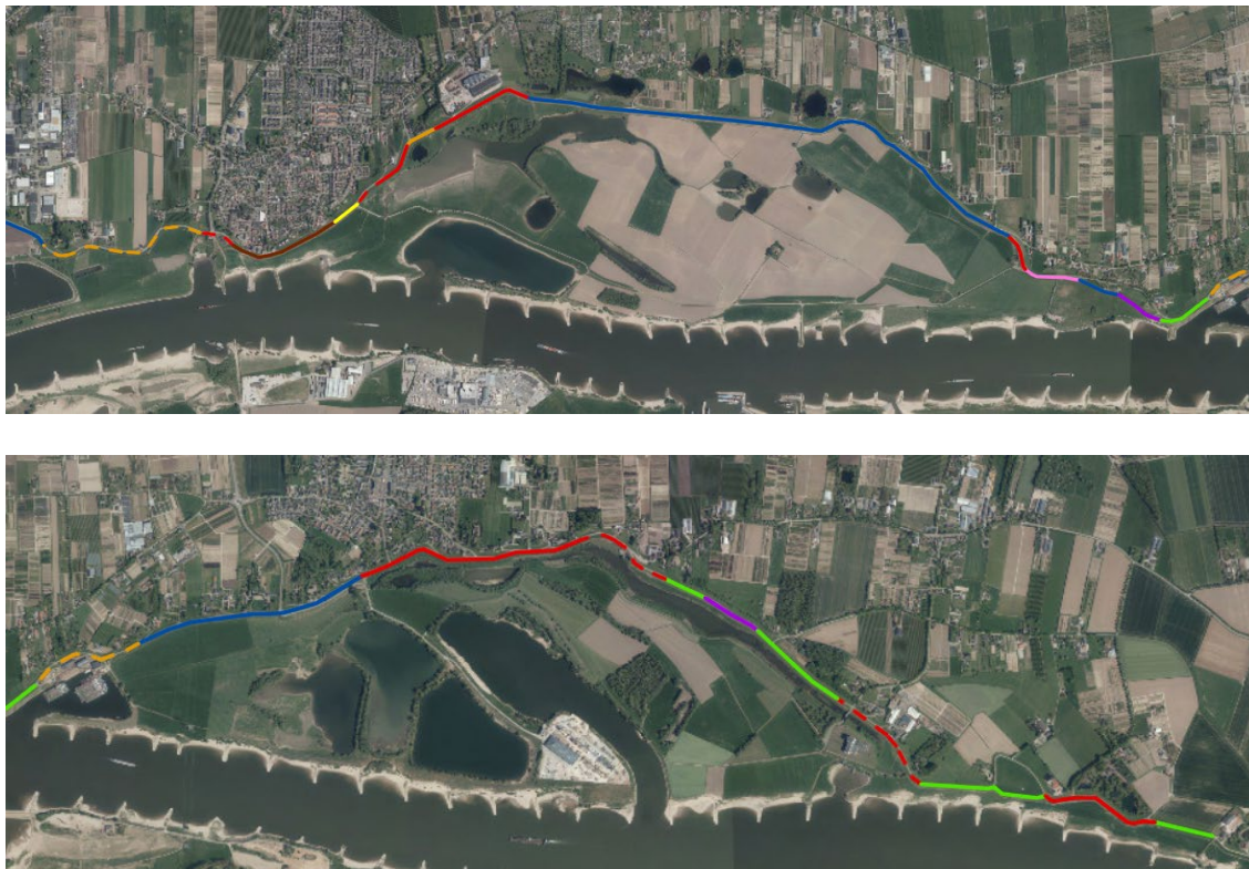
Figuur 3: Legenda bij het dijkversterkingsontwerp DO